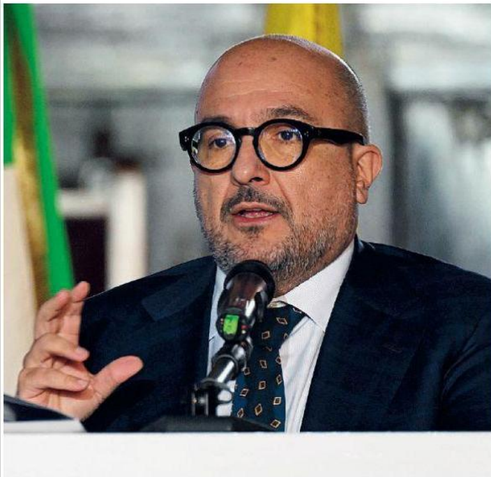
Cultura. Il ministro Gennaro Sangiuliano ospite a Taobuk

La proprietà intellettuale è riconducibile alla fonte specificata in testa alla pagina. Il ritaglio stampa è da intendersi per uso privato