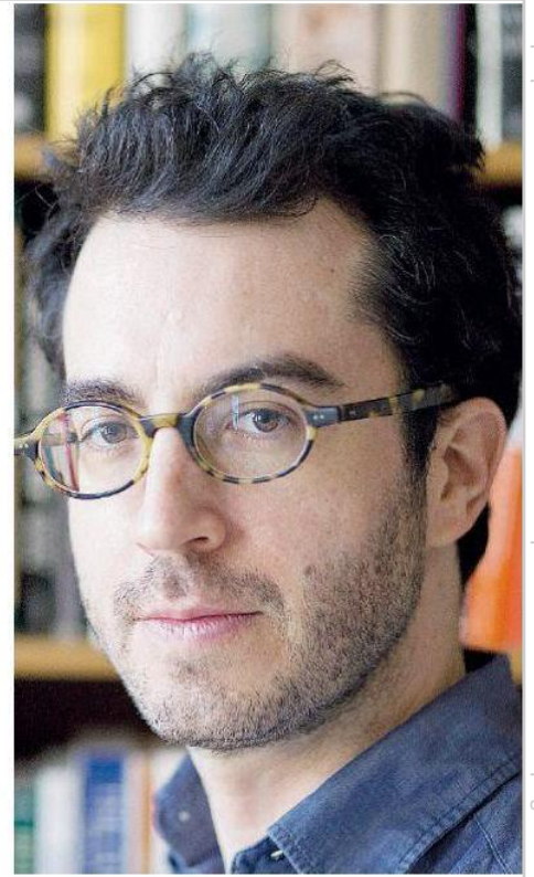
Big. Da sinistra Paolo Sorrentino, Ferzan Özpetek, Jonathan Foer

La proprietà intellettuale è riconducibile alla fonte specificata in testa alla pagina. Il ritaglio stampa è da intendersi per uso privato