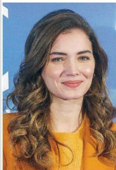
Vanina. L'attrice Giusy Buscemi