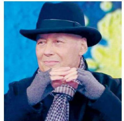
Premiati e ospite Dall'alto a sinistra Jon Fosse, Jonathan Safran Foer, Yasmina Reza e Alessandro Baricco